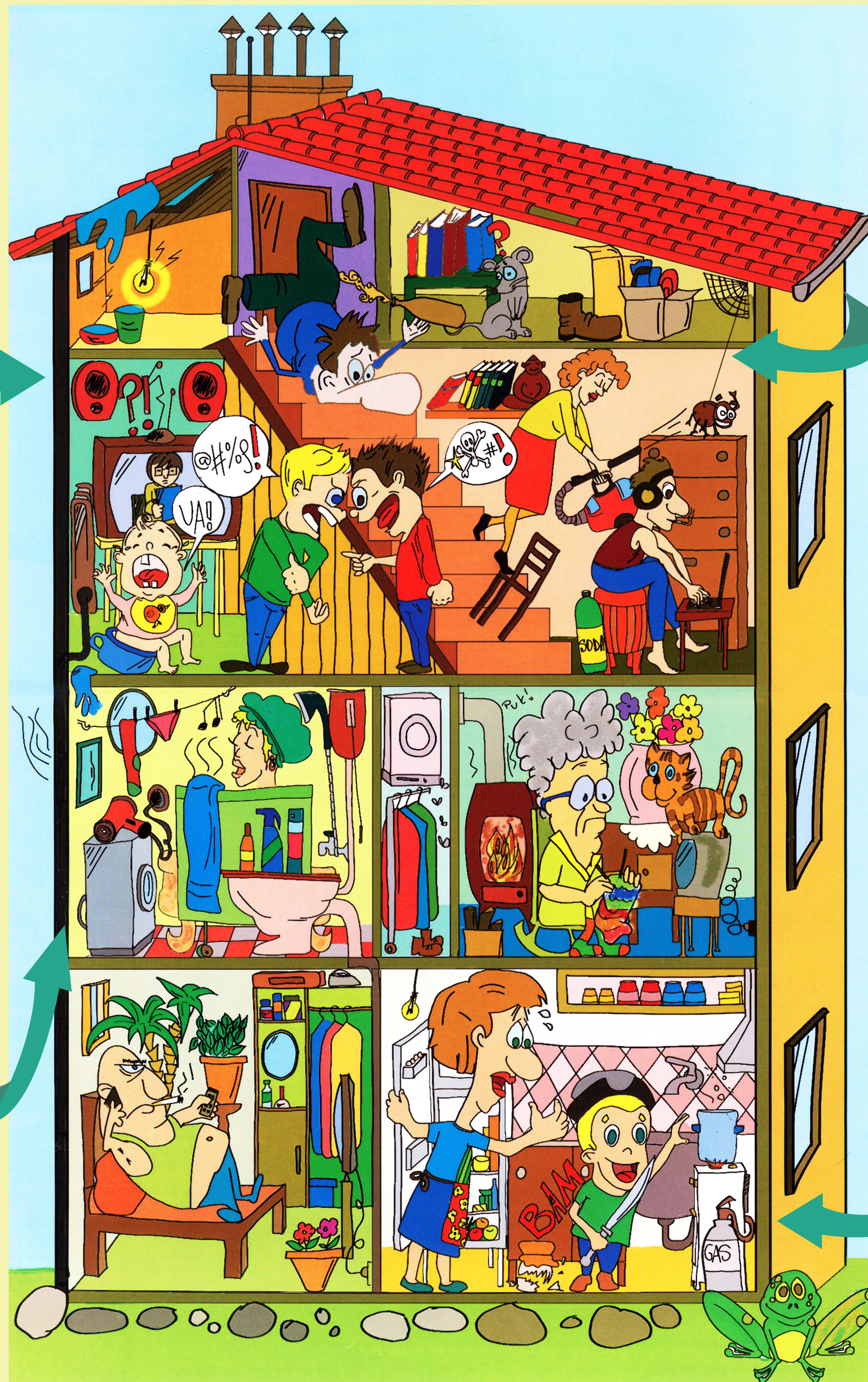
Ilustrace: Raya Mareva

Vyhodnocení testu: 12 - 15 Váš domov je bezpečný 9 - 11 Váš domov je celkem bezpečný 6 - 8 Váš domov není příliš bezpečný 0 - 5 Váš domov je rizikový