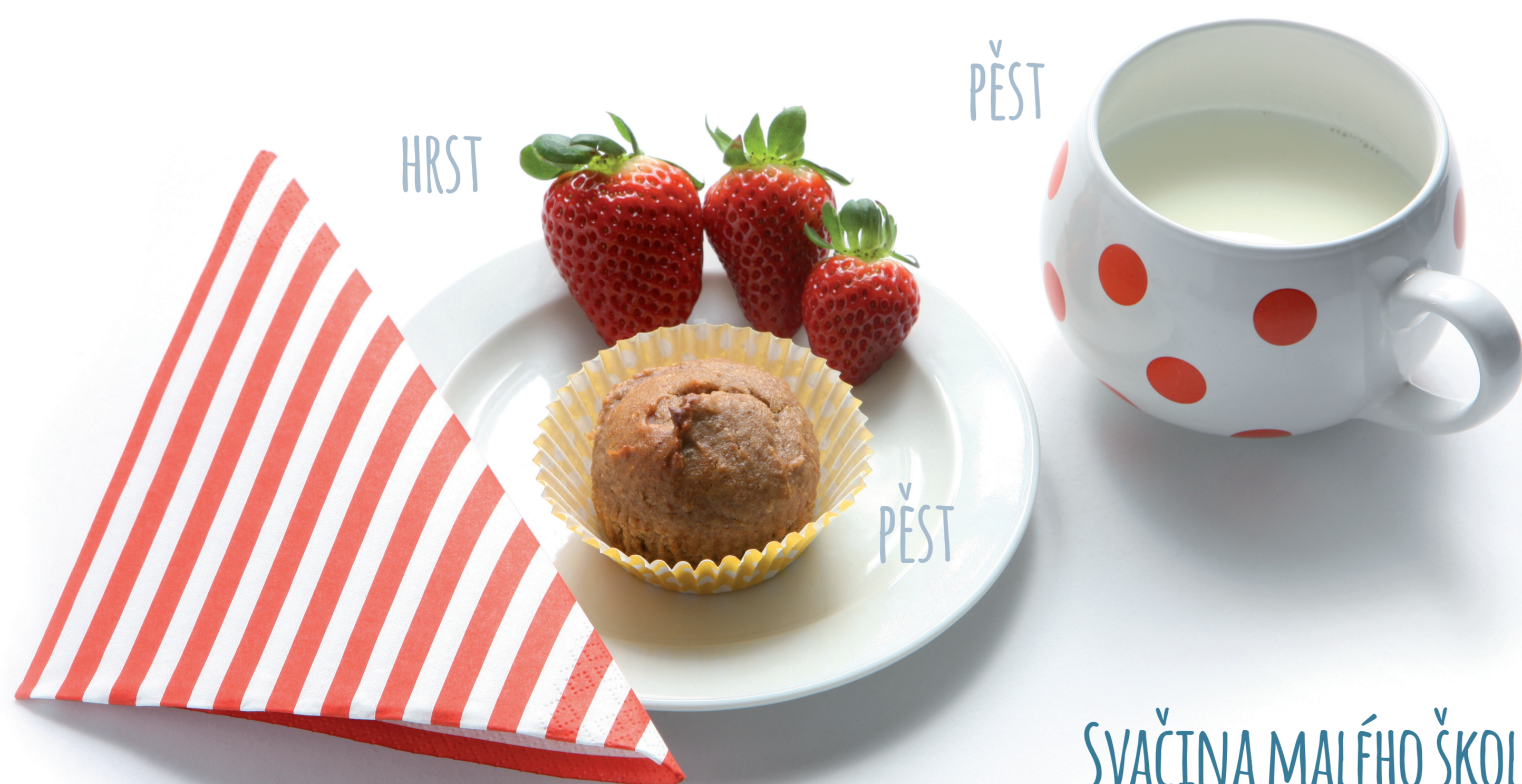
SVAČINA MALÉHO ŠKOLÁKA

■ 1 KOSTIČKA = 1 PORCE 1 PORCE = TVOJE PĚST, DLAŇ NEBO HRST