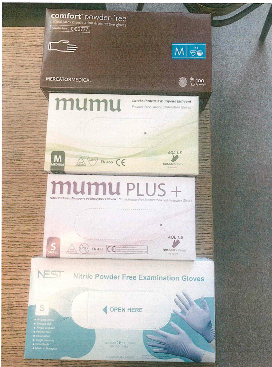
Příloha č. 1 – foto krabic nesterilních rukavic